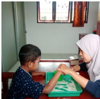
Gambar1. Pemantapan sensori

Kegiatan pemantapan fungsi sensori di SLB. Mutiara Hati, bisa dilihat dari foto dibawah ini,